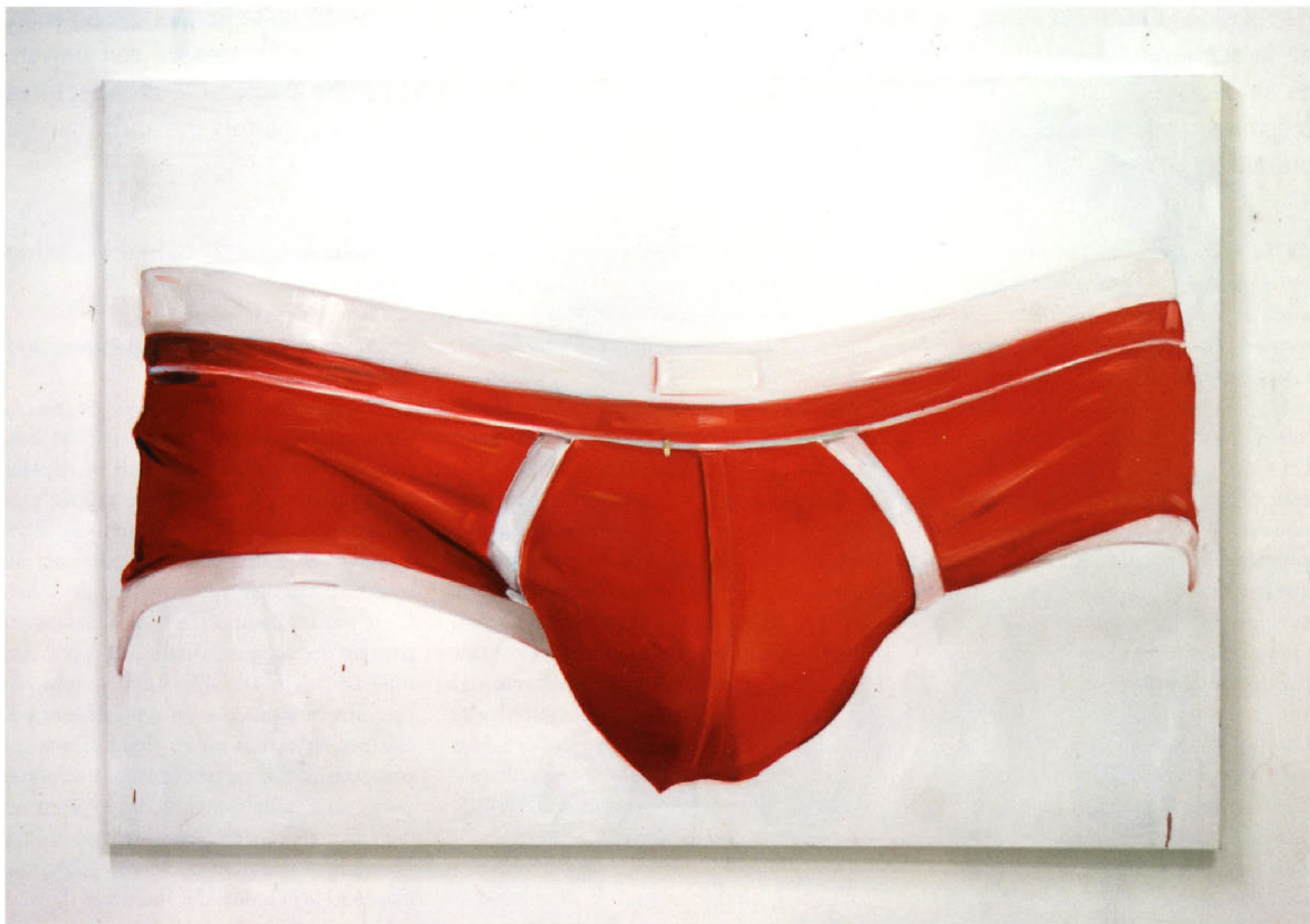
ci-dessus Slip rouge , 2010. Copyright Marc Wathieu. Courtesy Charlotte Beaudry. ci-dessous Mademoiselle nineteen 'Juliette' , 2009. Copyright Marc Wathieu. Courtesy Charlotte Beaudry