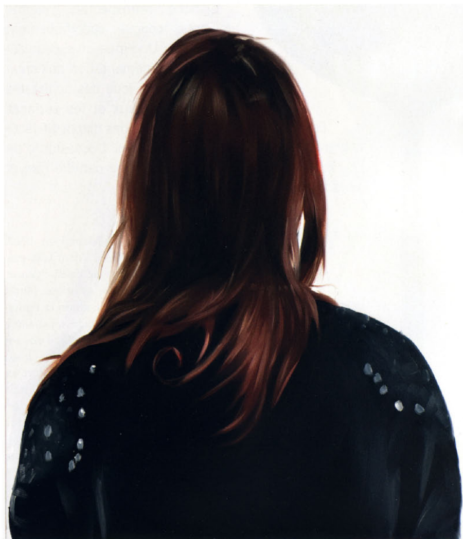
Mademoiselle nineteen 'Caroline', 2010. Copyright Marc Wathieu. Courtesy Charlotte Beaudry